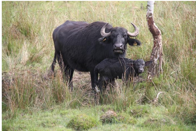
Die Wasserbüffel helfen, die Weide der DBU-Naturerbefläche Prora offen zu halten.

Gastronom Marco Matuschak hat die Büffel 2011 eingeführt und sie sind ein Erfolgsprojekt. Denn neben der Landschaftspflege besonderer Biotope werden in der Regel die männlichen Büffel, nachdem sie ein gutes Leben in Freilandhaltung auf den ausgedehnten Flächen verbringen durften, geschlachtet. Matuschak ist es wichtig, dass die Büffel sozusagen mit Haut und Haaren verwertet werden, nach dem Prinzip des nachhaltigen Wirtschaftens. Insbesondere die Büffelsalami, die auch auf den Bauernmärkten der Insel vertrieben wird, ist schon überregional bekannt und beliebt. Auch weitere kleinere Wandelinitiativen stellen ihre Ideen und Visionen für eine nachhaltige Zukunft in dieser Woche vor. Gut eignet sich dafür auch der Markt der nachhaltigen Initiativen, der am Ende der Woche der Nachhaltigkeit am 30. und 31.