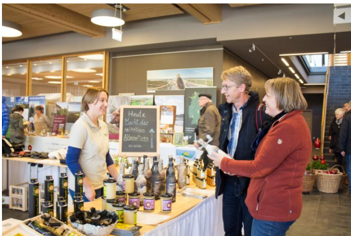
Nachhaltige Produkte aus der Region in der Woche der Nachhaltigkeit

und deren Produkte, zum Beispiel die Wolle, vermarktet und oft in Handarbeit verarbeitet werden. Oder eine Bioimkerei, eine Handweberei, ein Biogemüsebauer, der Verein Lebensgut, der um ein gutes Leben im Einklang mit der Natur wirbt, ein gemeinnütziger ökologischer und sozialer Verein mit Werkstätten für behinderte Menschen und vieles mehr. Alle saßen und sitzen bei der Vorbereitung des Events mit an einem Tisch – für ein sozial-ökologische Transformation Rügens. „Vielen Menschen auf der Insel ist das Nachhaltigkeitsthema bewusst, daher gibt es so viele verschiedene Initiativen“, so Peters. Doch um beim Thema nicht gegen Windmühlen anzukämpfen, sei es den Rügerner Wandelinitiativen wichtig, die dritte Säule der Nachhaltigkeit mit zu berücksichtigen.