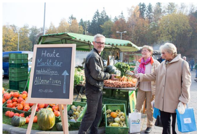
Markt der nachhaltigen Alternativen mit regionalen Anbietern

Land- und Forstwirtschaft sowie Tourismus sind zwei der wichtigsten Wirtschaftsfaktoren auf Rügen. Diese nachhaltig zu entwickeln und dabei den einzigartigen Naturraum erlebbar und bewusst zu machen, liegt im Interesse der InitiatorInnen der Woche der Nachhaltigkeit, die im Jahr 2016 vom 22. bis 29. Oktober stattfindet. Dabei arbeiten kleine und große Initiativen und Einrichtungen des Naturschutzes, der Land- und Forstwirtschaft, der regionalen ProduzentInnen und des Tourismus gemeinschaft-